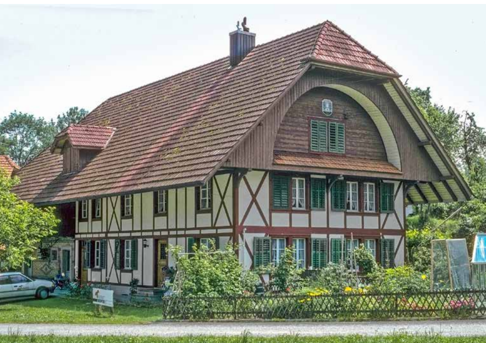
Wohnhaus und Firmenstandort 1989 bis 1998 in Grossdietwil

Bis zur Jahrtausendwende verkauften wir die Granuloseviren mehrheitlich in die Bioproduktion. Die Wachstumsmöglichkeiten beim damals noch kleinen Markt waren deshalb beschränkt. Somit diversifizierten wir die Eigenproduktion: Wir produzierten Schlupfwespen gegen die Weisse Fliege und den Maiszünsler, Raubmilben gegen Spinnmilben und Nematoden gegen Dickmaulrüsslerlarven und Trauermücken. Diese Eigenproduktionen mussten infolge billigerer Produkte aus dem Ausland später wieder eingestellt werden. Der Entscheid, uns auf unsere Kernkompetenz in der Insektenvirenproduktion zu konzentrieren sowie die Fokussierung auf die Auto-