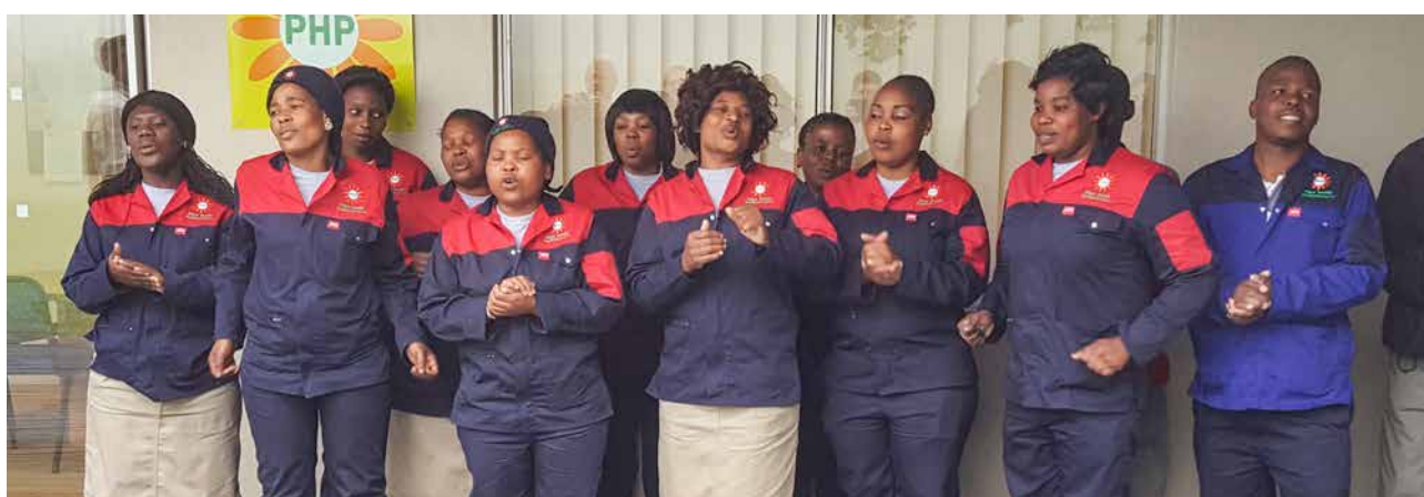
Firmengebäude und Gruppenfoto des PHP-Produktions-Teams in Südafrika