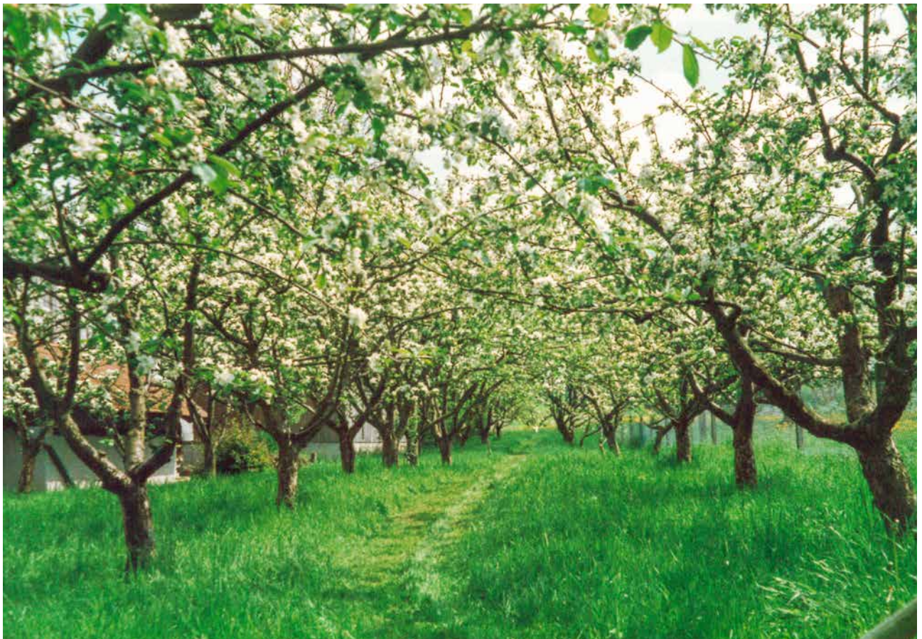
Obstgarten in Oberhasli