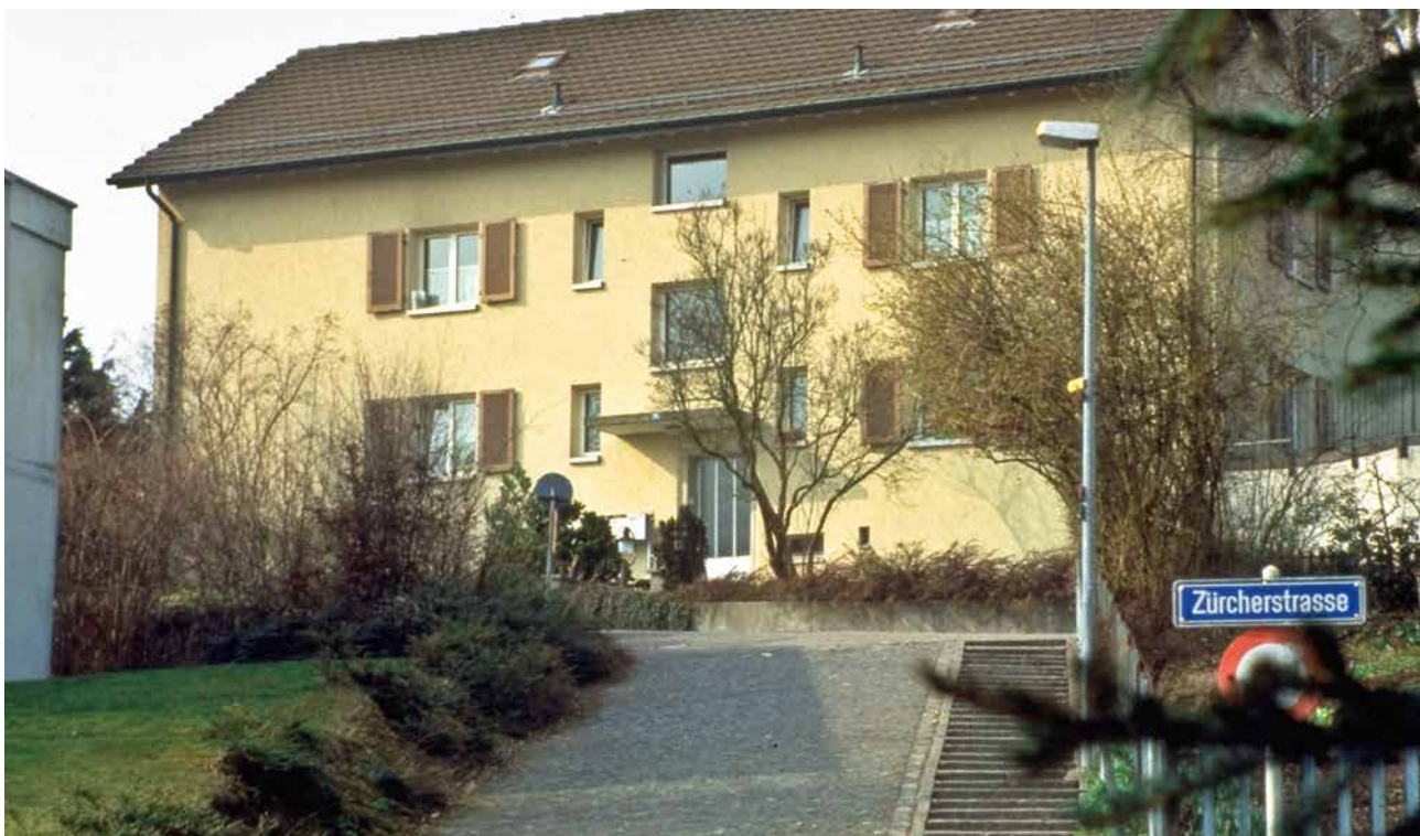
Mehrfamilienhaus Oberglatt: Erster Firmensitz der Andermatt Biocontrol