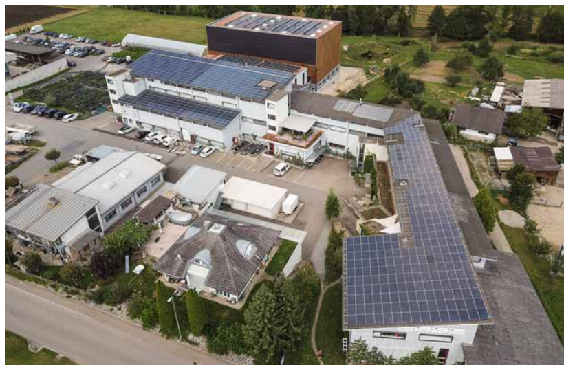
Firmengebäude der Andermatt Gruppe in Grossdietwil

Als Verfechter des biologischen Pflanzenschutzes war ich mir lange nicht sicher, ob ich überhaupt einen Preis annehmen darf, der mit Geld alimentiert wurde, das ursprünglich aus der Agrochemie stammt. Da der Stiftungsrat aber bekräftigt hat, dass es ihm mit der Auszeichnung eines Pioniers im biologischen Pflanzenschutz ernst ist, und diese Auszeichnung ja auch dazu führen kann, dass der aktuelle Wandel im Pflanzenschutz einem grösseren Publikum bekannt wird, nehme ich diesen Preis gerne an. Herzlichen Dank! Aufgrund des Klimawandels ist es noch vordringlicher, das weltweite Bevölkerungswachstum in den Griff zu bekommen. Das Preisgeld fliesst deshalb als Spende an die Rotary-Stiftung «Rotary Action Group for Reproductive, Maternal and Child Health» ( www.rotary-rmch.ch ).